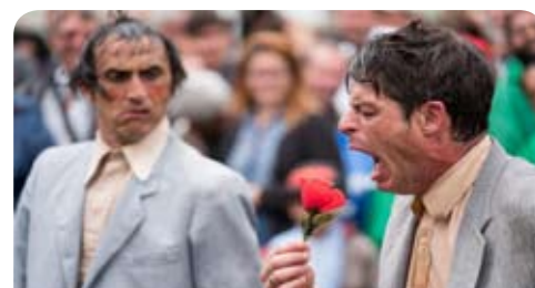
Vie Culturelle p20