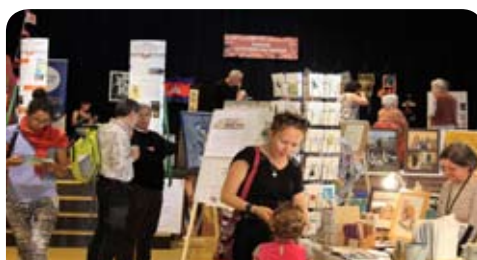
Vie Associative p19