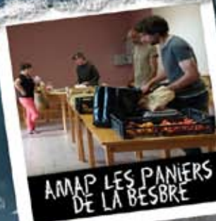
AMAP LES PANIERS DE LA BESBRE