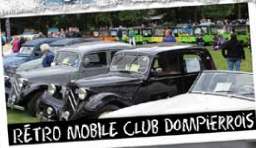
RÉTRO MOBILE CLUB DOMPIERROIS