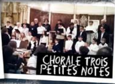
CHORALE TROIS PETITES NOTES