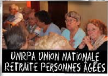
UNRPA UNION NATIONALE RETRAITE PERSONNES ÂGÉES