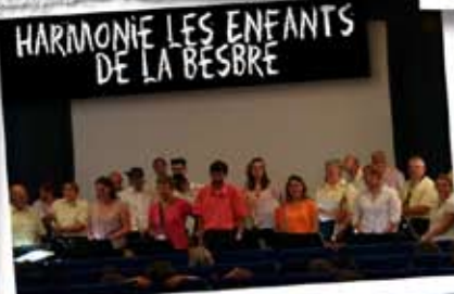
HARMONIE LES ENFANTS DE LA BESBRE