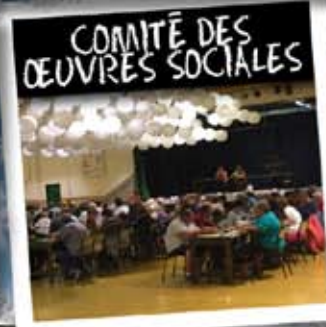
COMITÉ DES OEUVRES SOCIALES