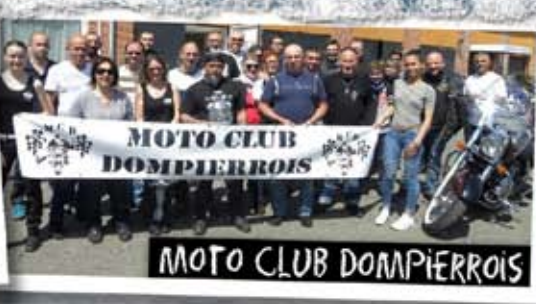
MOTO CLUB DOMPIERROIS