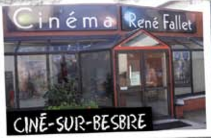
Cinéma René Fallet