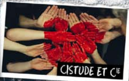
CISTUDE ET C IE