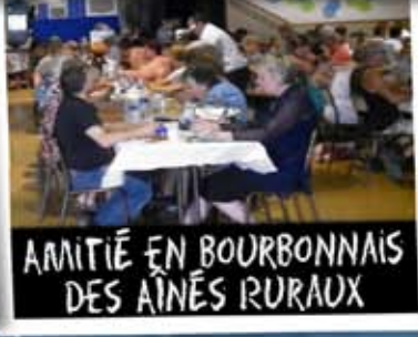
AMITIÉ EN BOURBONNAIS DES AÎNÉS RURAUX