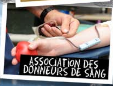
ASSOCIATION DES DONNEURS DE SANG