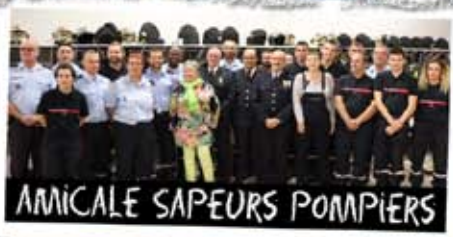
AMICALE SAPEURS POMPIERS