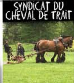
SYNDICAT DU CHEVAL DE TRAIT