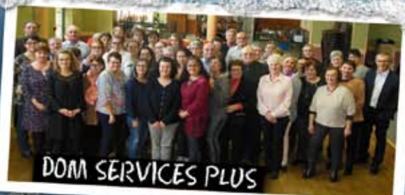
DOM SERVICES PLUS