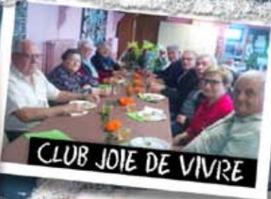
CLUB JOIE DE VIVRE