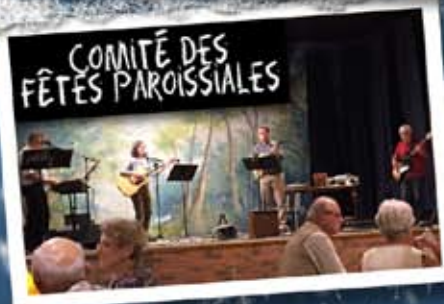
COMITÉ DES FÊTES PAROISSIALES