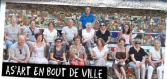
AS'ART EN BOUT DE VILLE