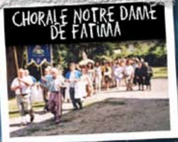
CHORALE NOTRE DAME DE FATIMA