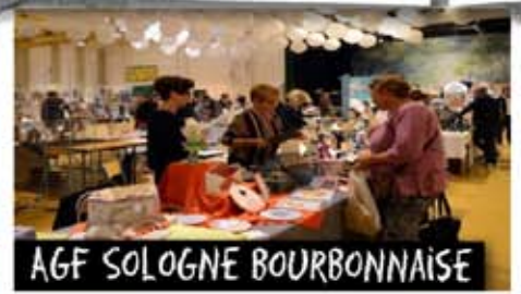
AGF SOLOGNE BOURBONNAISE