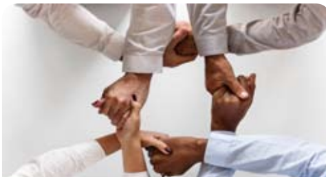
Vie Associative p11