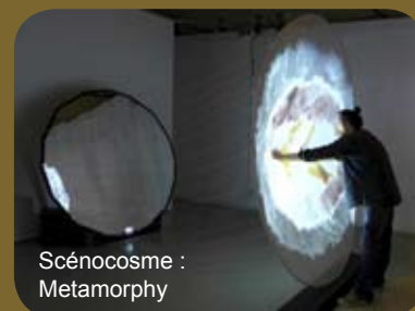
Scénocosme : Metamorph