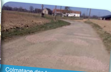
Colmatage des trous de voirie proche de l'Abbaye de Sept-Fons