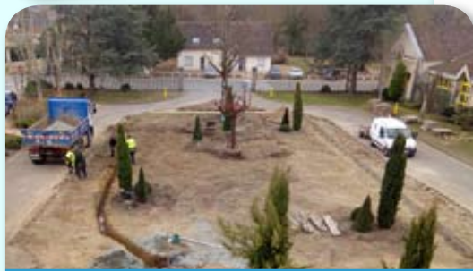
Aménagement de la cour de la Mairie