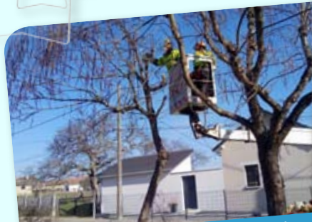
Élagage des arbres rue des 5 Noyers