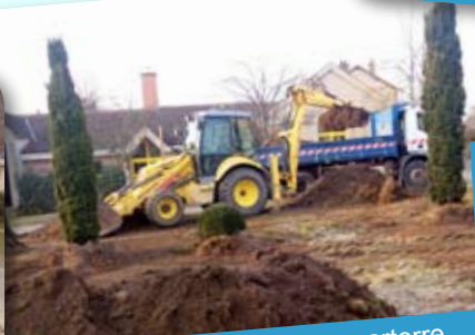
Création du nouveau parterre