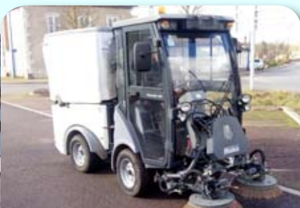
Passage de la balayeuse dans les rues