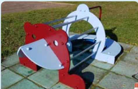
Peinture des jeux de l'Accueil de Loisirs