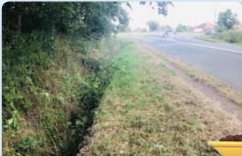
Curage de fossés