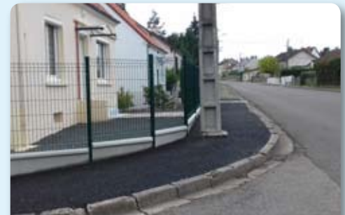
Réfection de trottoirs