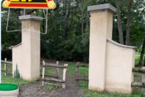
Création d'une barrière à la Roseiraie