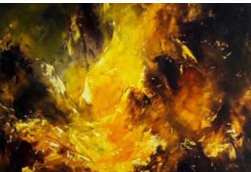
Passage lumineux de René BARLE