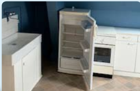
Remise en état de l'appartement Rue de 7 Fons