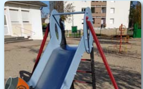
Maintenance des jeux à l'École Maternelle