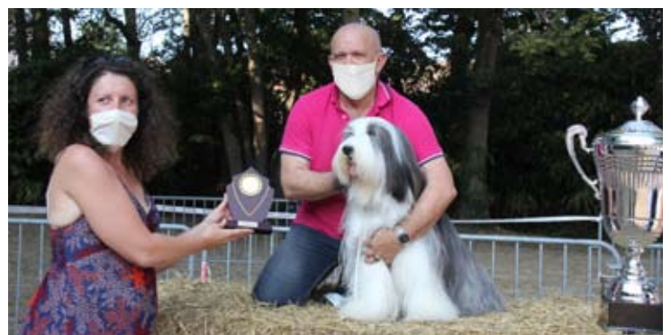
Un bearded collie qui n'a pas volé sa récompense.

L a septième édition de l'exposition canine nationale, organisée par la Société canine territoriale du Bourbonnais s'est déroulée les 12 et 13 septembre 2020 au parc de la Roseraie. Cette année, la race mise à l'honneur était le braque d'Auvergne. Environ 850 chiens de 240 races différentes ont participé à cette manifestation. Une séance de confirmation qui a accueilli près de 350 chiens a eu lieu le samedi alors que le dimanche fut consacré à l'exposition et aux différents concours.