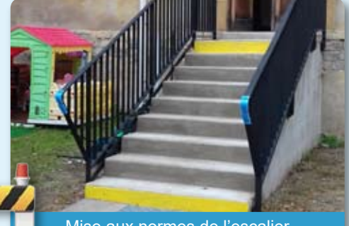
Mise aux normes de l'escalier d'accès à la MAM