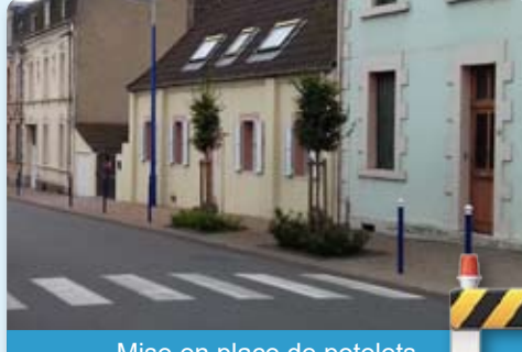
Mise en place de potelets Rue Nationale