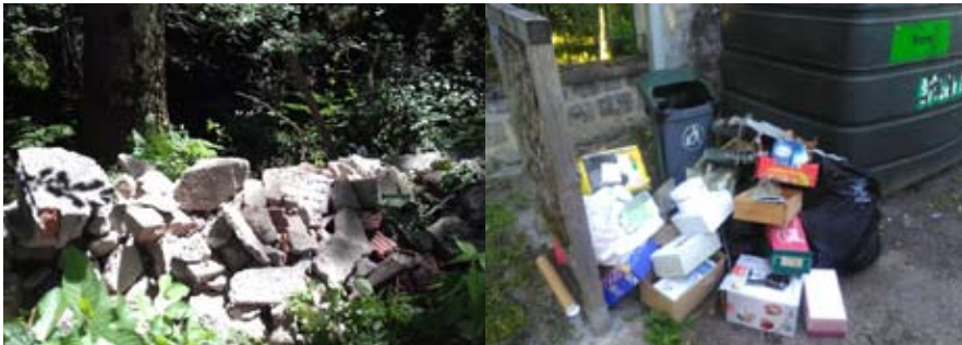
Étang chemin d'Hauterive aux Prélots

Alors, la prochaine fois, pensez à la déchetterie !