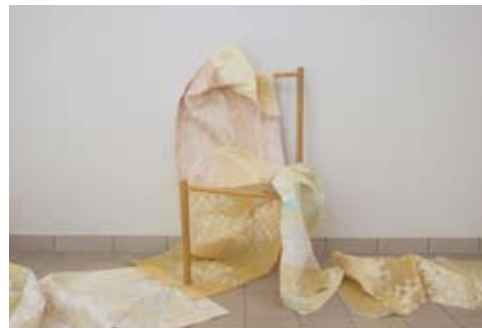
In Their Chairs de Zach MILTAS

> INAUGURATION DU SÉJOUR, LE VENDREDI 15 JANVIER 2021 À 18 H 30