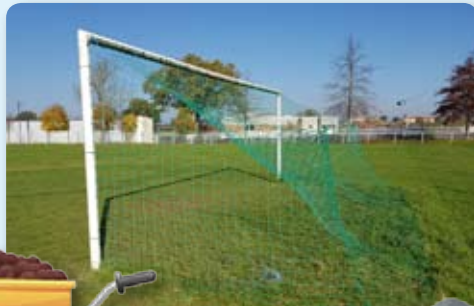
Pose de buts de foot au Chambon